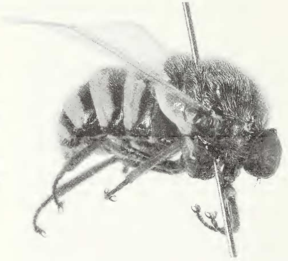
Abb. 1, 2: Ogcodes gibbosus (Linneaus, 1758); 1. nach SACK (1936), 2. präpariertes Tier aus dem Landkreis Karlsruhe